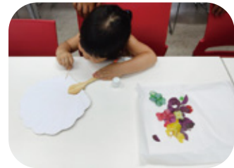
압화거울, 부채 만들기